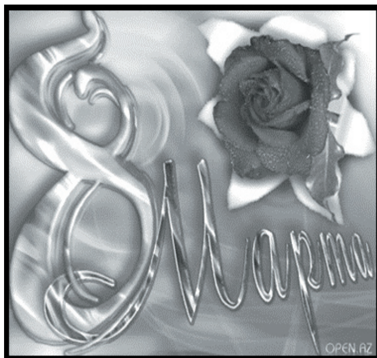
8 марта стр.10