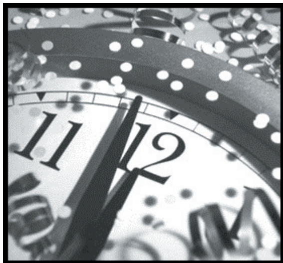
Новый 2012 год стр.8-9