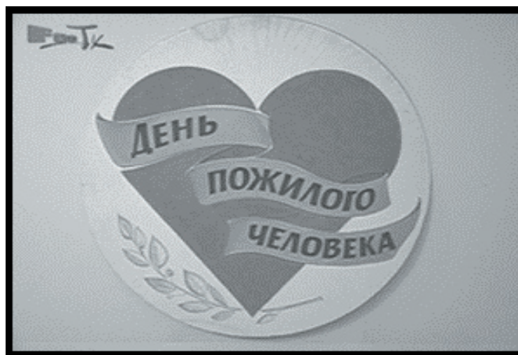
День пожилого человека стр.7